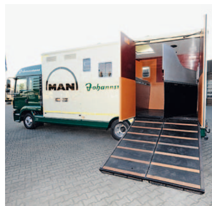
Sechs dieser Pferdetransporter befördern in London die Olympia-Pferde.