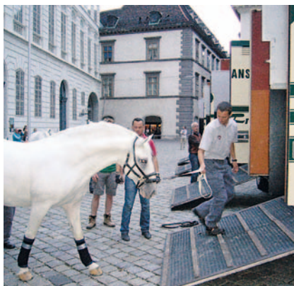
Auch die Lipizzaner der Spanischen Hofreitschule fahren mit Johannsmann-Lkw.